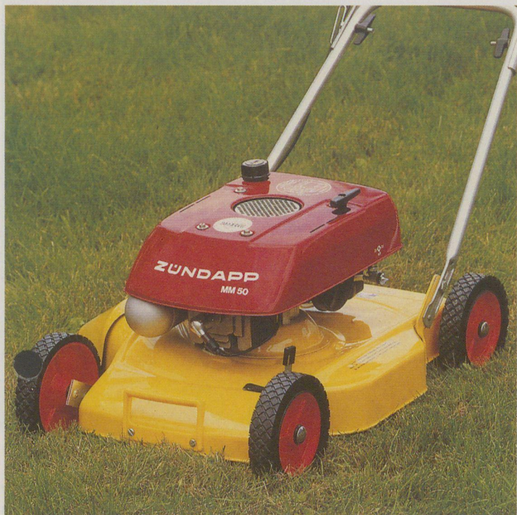
MM 20 Motormäher, 2,2 kW, Schnittbreite 38 cm, Mähleistung ca. 1200 qm pro Stunde