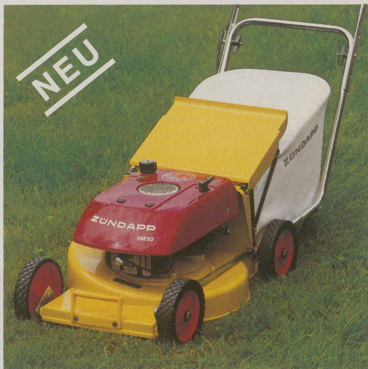
HM 50 Motormäher mit Heckauswurf, 2,2 kW, mit elektronischer Zündanlage, Schnittbreite 44 cm, Mähleistung ca. 1400 qm pro Stunde